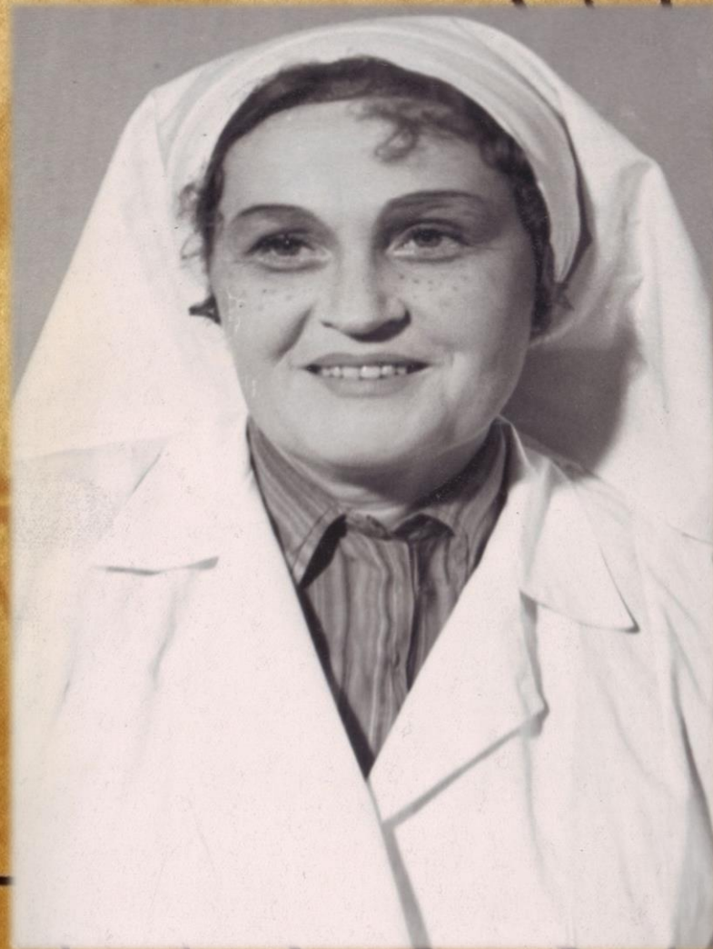
Фонд Р-983, опись 1, дело 5, лист 26