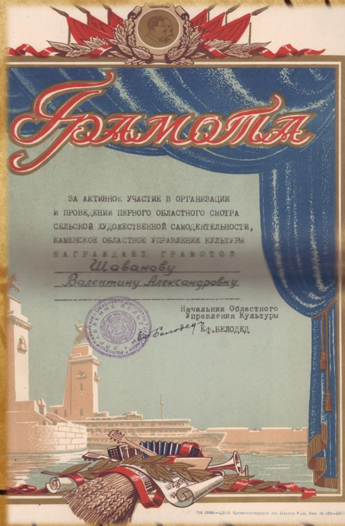
Фонд Р-983, Опись 1, Дело 7, Лист 6