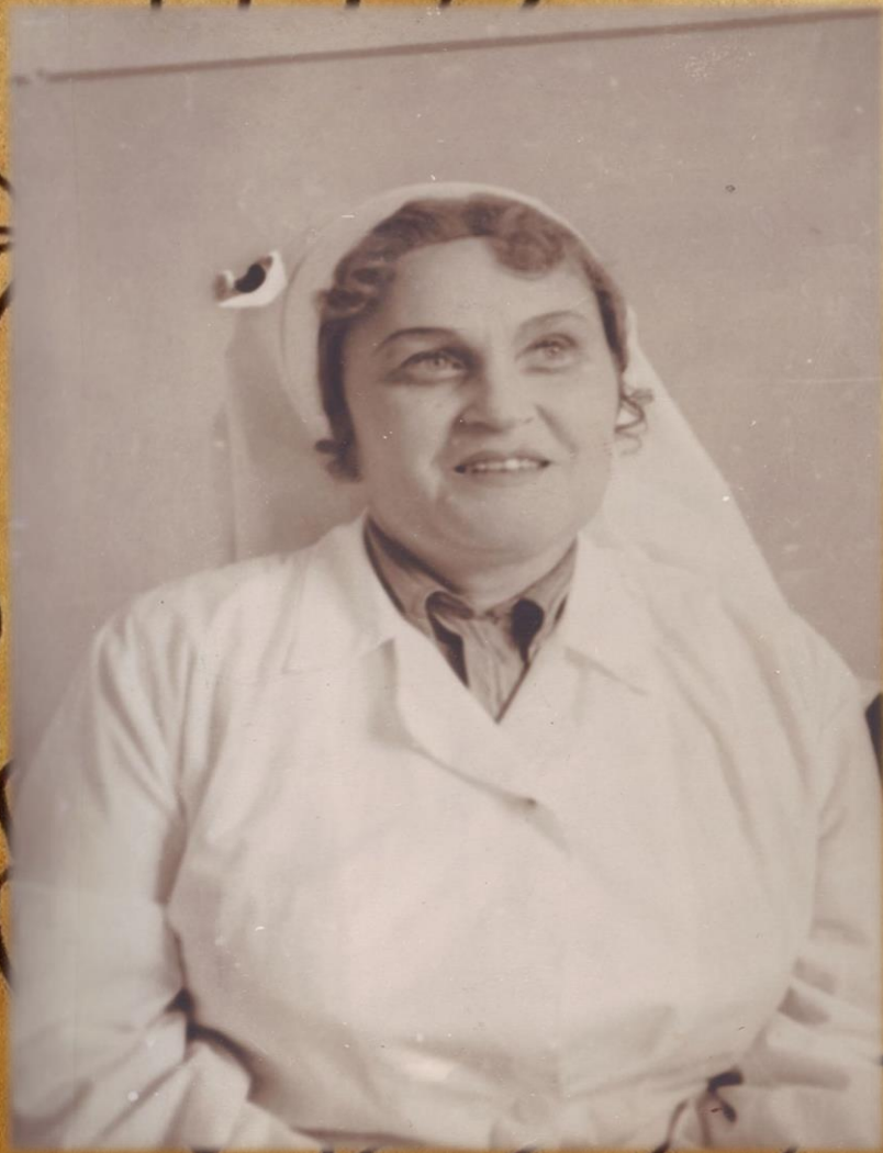
Фонд Р-983, опись 1, дело 5, лист 21