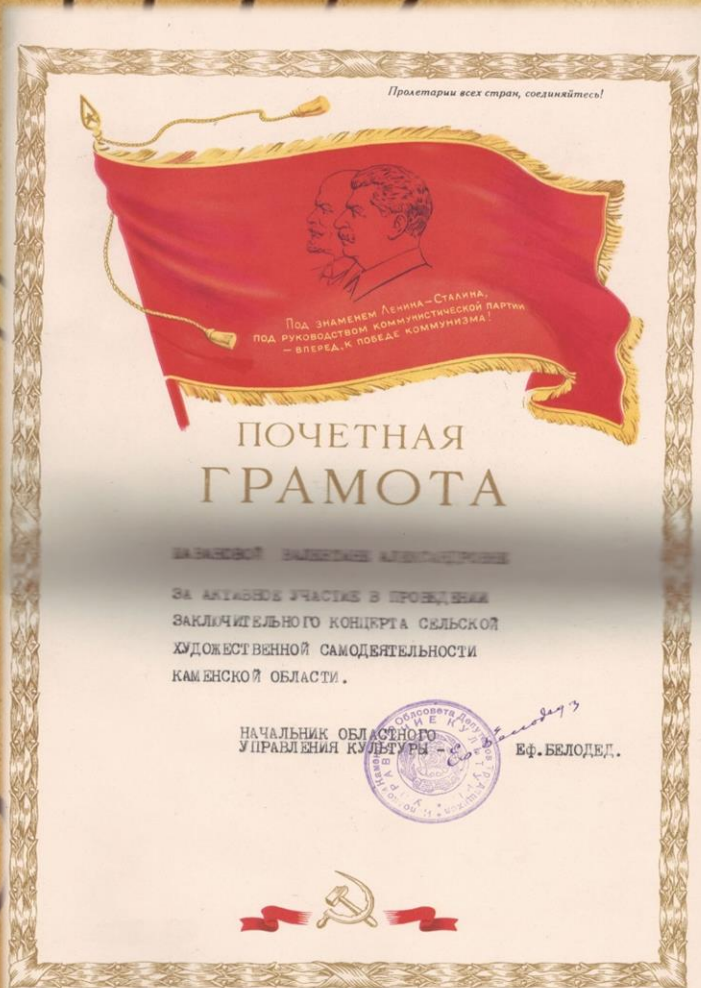
Фонд Р-983, Опись 1, Дело 7, Лист 5